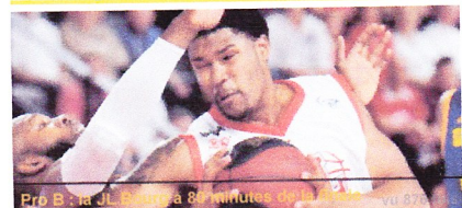
Pro B : la JL Bourg a 86 minutes d'arrêt vu 87 fois